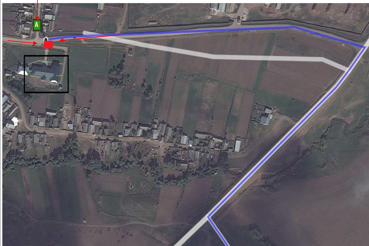
Схема безопасных маршрутов